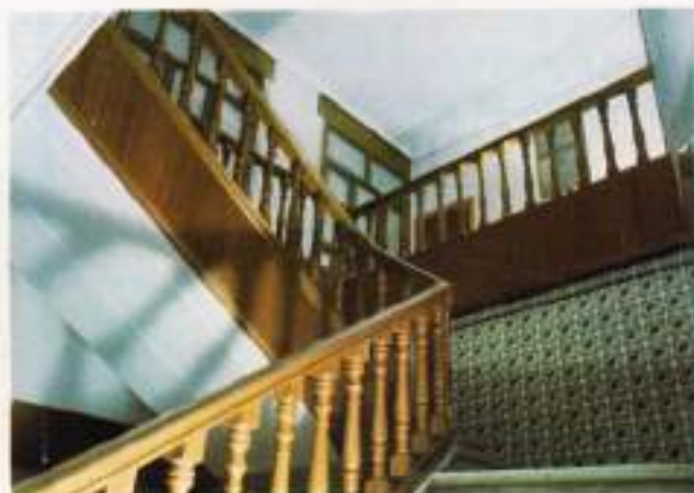
Vistas de algunas dependencias del Ayuntamiento