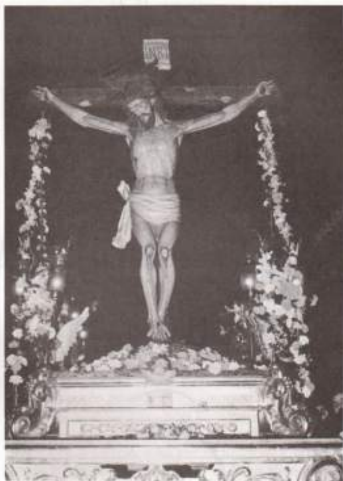
STMO. CRISTO DE LAS INJURIAS Patrón de Lillo (Toledo)