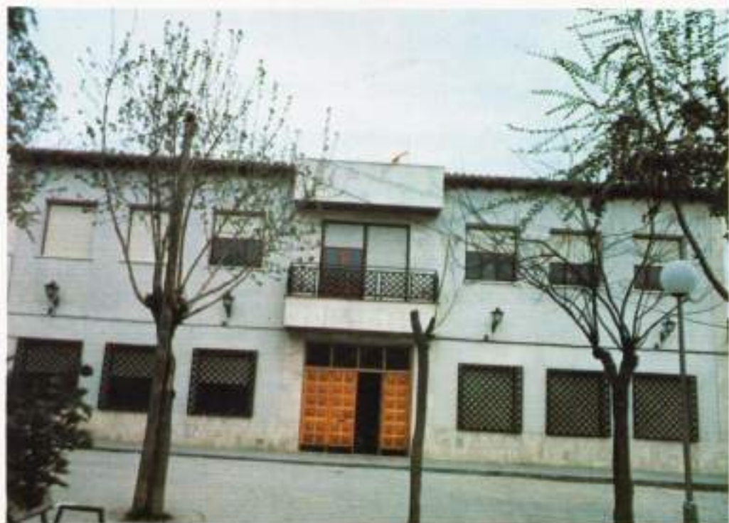
Vista principal del Ayuntamiento